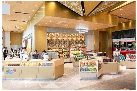
4 Mood : Curious エリア