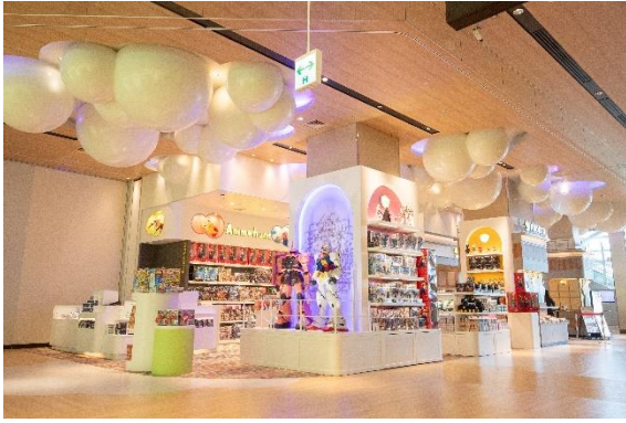
4 Mood : FUN エリア