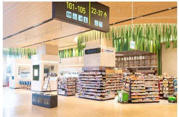
4 Mood : Peaceful エリア