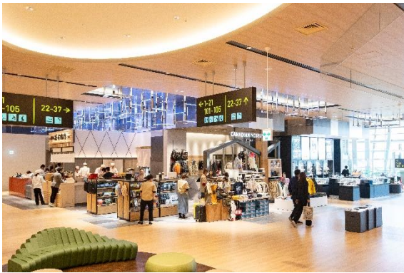
4 Mood : Active エリア