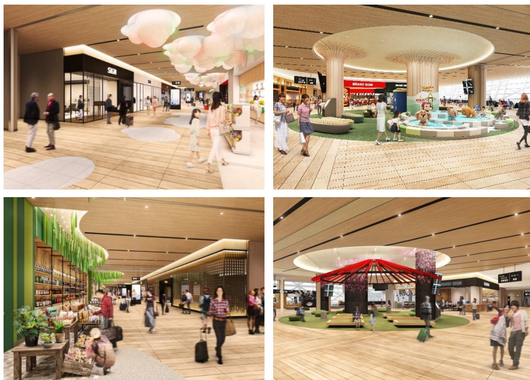
拡張予定の国際線新商業エリア イメージ

関西エアポートグループは、これからも関係の皆さまと連携し、国内外のお客さまをお迎えする関西地域のゲートウェイとして、新しい旅の体験を創造してまいります。