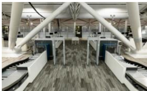
国際線保安検査場