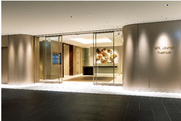
KIX Lounge Premium

○到着時に利用できる免税店オープン、国際線保安検査場の南北に新規商業エリアオープン