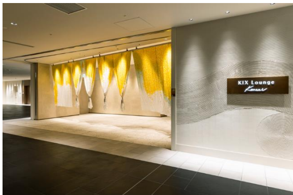
KIX Lounge Kansai